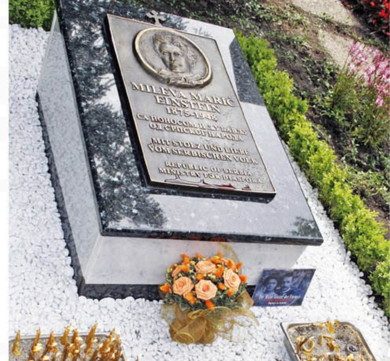
▲ ОДЛАЗАК Спомен-плоча на циришком гробљу и Милевин посмртни лист (десно)