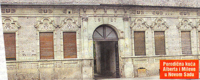
Porodična kuća Alberta i Mileve u Novom Sadu