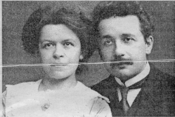
МИЛЕВА МАРИЋ И АЛБЕРТ АЈНШТАЈН