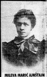
MILEVA MARIĆ AJNŠTAJN