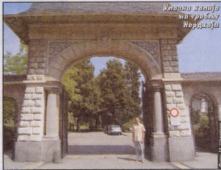
Улазна капија на гробљу Нордхајм