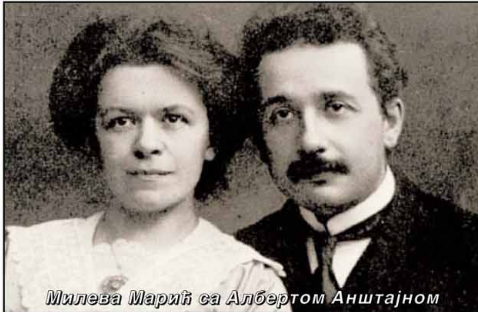
Милева Марић са Албертом Анштајном

одржана у мају 2005. године. Биће то у оба случаја сјајна прилика да свету, мимо противљења јеврејске заједнице из Европе и Израела, покажемо како је