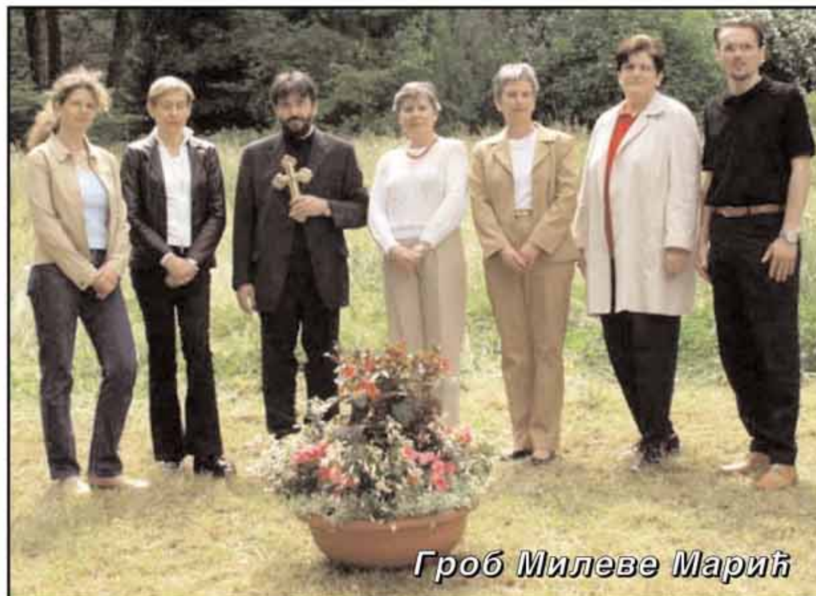
Гроб Милеве Марић

- Ја сам за гроб Милеве Марић сазнао сасвим случајно од католичког фратра у Цириху, који ми је рекао да је Ханц Ајштјан, Милевин и Албертов син још 1973. престао да плаћа гробно место своје баке. Од тада је гроб зарастао у траву и потпуно нестао са лица земље. Чак ни Милевин син, са којим сам разговарао није знао где је њен гроб. А рекао ми је да гроб његовог оца Алберта Ајштајна уопште не постоји. Два месеца сам уз помоћ управника гробља Нортхајм трагао за парцелом број 9357 на којој је 6. јуна 1948.