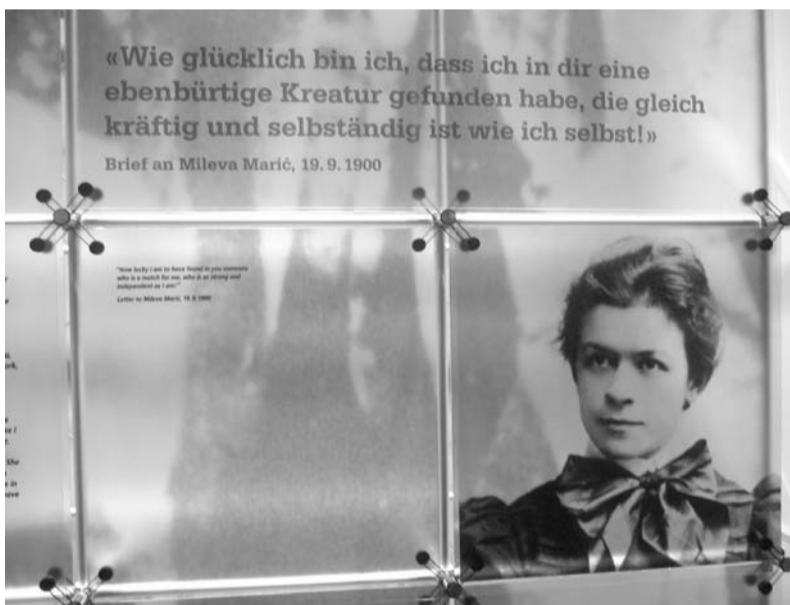
ПАНО СА СЛИКОМ МИЛЕВЕ МАРИЋ И ЦИТАТИМА ИЗ ЛЉУБАВНИХ ПИСАМА

По повратку кући из Берна, где је резултате својих истраживања