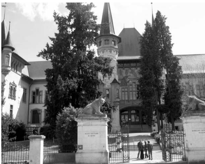
ИСТОРИЈСКИ МУЗЕЈ У БЕРНУ

штајн - Марић живео је од октобра 1903. све до октобра 1909. године, када су се преселили (вратили) у Цирих. Ту им се, 1904, родио старији син Ханс Алберт, ту су настали они чувени, многи данас тврде, заједнички научни ра-